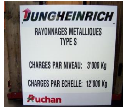
Pancarte logo société