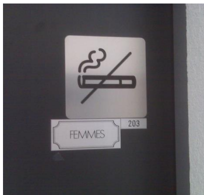
Interdiction de fumer