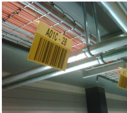
Pancarte code à barres accrochée à un câble