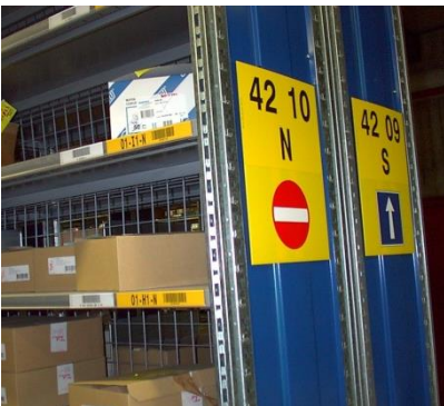
Sens de circulation