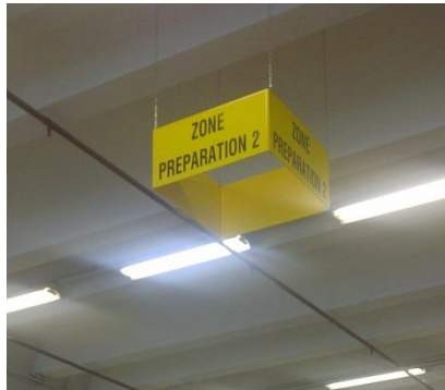
Pancarte rectangulaire « zone »