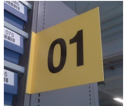
Pancarte drapeau recto/verso pliée