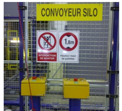
Consignes de sécurité