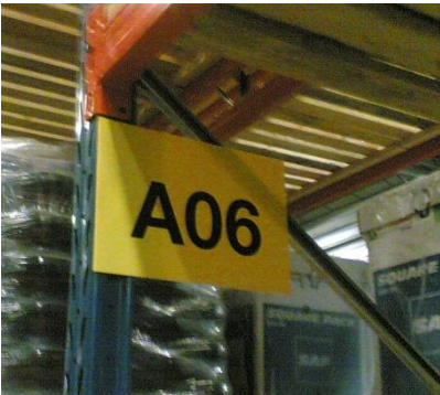
Zone de stockage